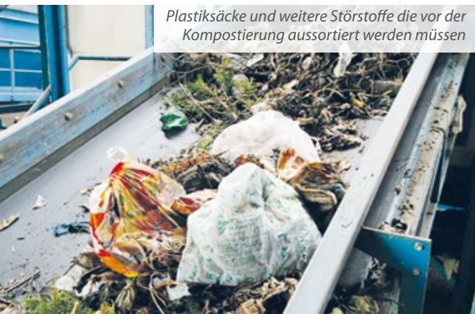
Plastiksäcke und weitere Störstoffe die vor der Kompostierung aussortiert werden müssen

Produkte aus kompostierbaren Kunststoffen begegnen einem immer öfter. Plastikbeutel und Kaffeekapseln sind beispielsweise auch mit dem Herstellerhinweis „kompostierbar“ erhältlich. Das Problem dabei ist allerdings, dass deren Kompostierung unter Bedingungen wie sie in vielen Kompostierungsanlagen herrschen nicht bzw. so langsam erfolgt, dass die Kunststoffe vor der Kompostierung aussortiert werden müssen, damit sie am Ende nicht als Störstoffe im Kompost vorliegen. Wichtig zu wissen ist auch, dass in Kompostierungsanlagen in denen der vollständige Abbau kompostierbarer Kunststoffe technisch möglich ist, aus diesen keinerlei bodenverbessernde Stoffe gewonnen werden, da diese einfach nicht darin vorhanden sind.