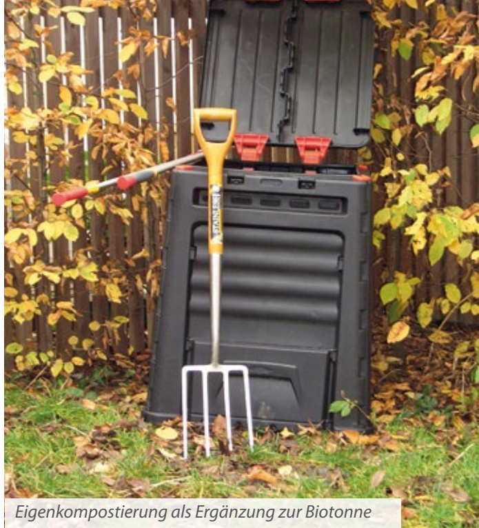
Eigenkompostierung als Ergänzung zur Biotonne

Bitte beachten Sie daher unbedingt, dass Sie keine kompostierbaren Kunststoffe, insbesondere auch keine Säcke aus diesem Material in die Biotonne geben. Bioabfälle können in Zeitungspapier eingewickelt oder in Papiertüten in die Biotonne gegeben werden. Wenn der Hersteller Ihrer Kaffeekapseln damit wirbt, dass diese über den Gelben Sack entsorgt werden können, ist dies der richtige Entsorgungsweg, ansonsten werfen Sie die Kapseln in die Restmülltonne.